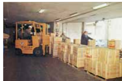
高床式プラットホーム