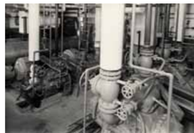
ヨコレイ初の高速多気筒二段圧縮型冷凍機