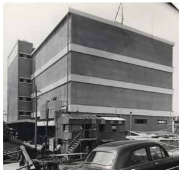
新港埠頭工場(1963 (昭和38) 年9月) 帯状の突起がコルクを使った鉢巻き状の防熱