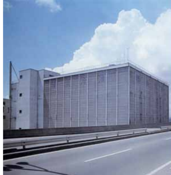
子安工場1号館 (1969 (昭和44) 年)