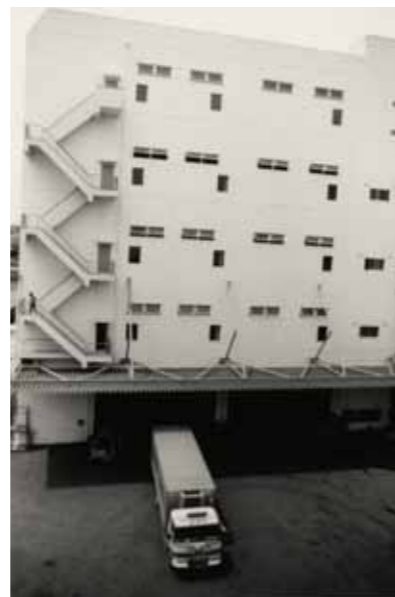
子安工場2号館 (1975 (昭和50) 年)

輸入のレモンやグレープフルーツなど果実も扱っていたから、燻蒸庫やリパック室も完備していたんだよ。この時代輸入品がどんどん増加していて、生鮮果実の輸入も盛んになってきたからね。