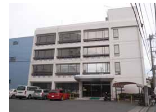
2号館が完成した昭和50年に作られた「職場の指針」

1階は畜産部が入り、2階に役員室と総務部、3階にシステム部とコンピューター室、4階に会長室と経理部があった。