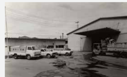
設立当初の畜産部事務所と子安工場常温庫

1970 (昭和45) 年に開設された販売部門の事業所で、神奈川や東京の飲食店に直接自社の配送車で食材を卸す業務を行っていたんだ。同じように自社の配送車を使った食材の卸売業務は、畜産部以外にも札幌営業所、名古屋営業所でもやっていたね。